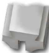
Schienenstück für Drillinge/Rail piece for drillings/Rail pour drillings