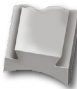
Schienenstück für BBF/Rail piece for mixed barrel guns/Rail pour fusils mixtes superposés